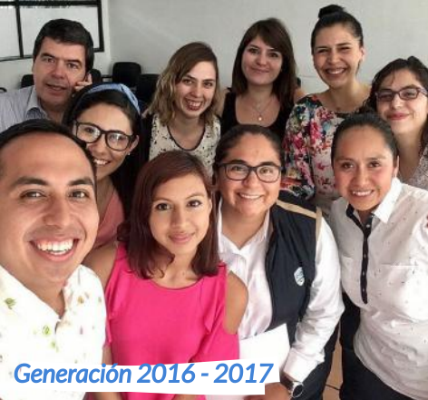
Generación 2016 - 2017