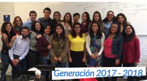
Generación 2017 - 2018